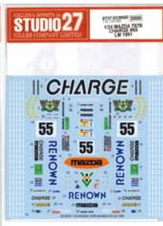
ST27-DC959D 1/24 787B CHARGE #55 LM 1991 decal ST27-DC1220 1/24 Ford GT #67 Daytona 2019 decal ST27-DC1222 1/24 Ford GT #66 Daytona 2019 decal